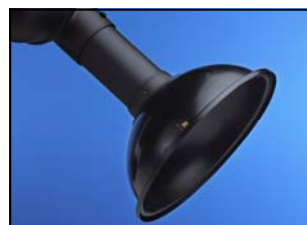
Hotte circulaire polypropylène noir Diamètre : 350 mm Réf. 100-350 PP ATEX Code informatique : 1-10035-6