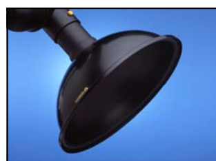
Hotte circulaire polypropylène noir