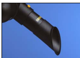
Bec d'aspiration polypropylène noir