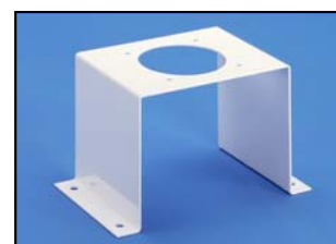
Etrier de fixation Réf. 30-75-5-6