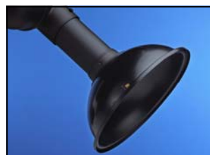
Hotte circulaire polypropylène noir Diamètre : 350 mm Réf. 100-350 PP ATEX Code informatique : 1-10035-6