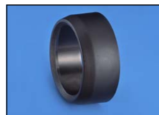
Pièce de réduction Réf. 75-80 RM ATEX Code : 4-8075-6