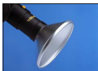
Cône d'aspiration aluminium

Code : 2-1000-050-20 (Refoulement vertical)