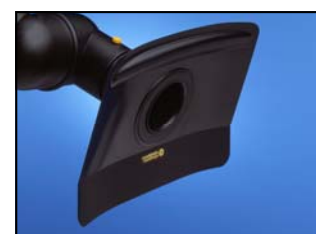
Ecran d'aspiration L x l (mm) : 330 x 240 Réf. 75-330-240 PP ATEX Code : 1-753324-6