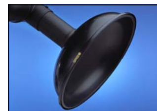
Hotte circulaire polypropylène noir Diamètre : 500 mm Réf. 100-500 PP ATEX Code informatique : 1-10050-6