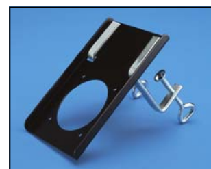
Console de table Réf. 75-100 BB NOIRE