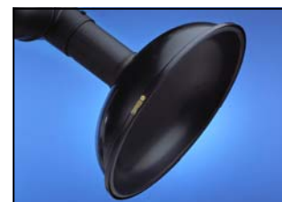
Hotte circulaire polypropylène noir Diamètre : 500 mm Réf. 100-500 PP ATEX Code informatique : 1-10050-6