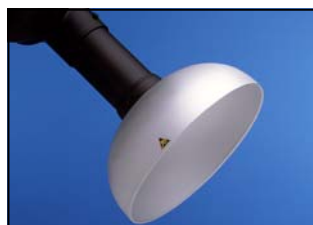
Hotte circulaire aluminium Diamètre : 350 mm Réf. 100-350 HR ATEX Code informatique : 1-10036-6