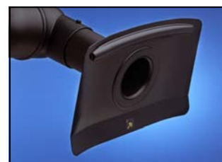
Ecran d'aspiration L x l (mm) : 420 x 280 Réf. 100-420-280 PP ATEX Code informatique : 1-1004228-6