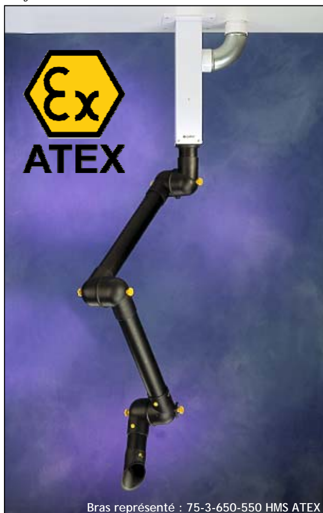
Bras représenté : 75-3-650-550 HMS ATEX