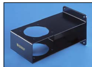
Console de fixation murale Réf. 75-250 VB NOIRE Code : 2-7525-050 (existe en inox)