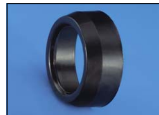
Pièce de réduction Réf. 125-100 RM ATEX Code informatique : 4-100125-6