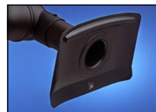
Ecran d'aspiration L x l (mm) : 420 x 280 Réf. 100-420-280 PP ATEX Code informatique : 1-1004228-6