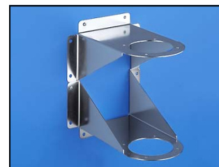
Console murale Réf. 100-350 VB INOX Code informatique : 2-10035-22