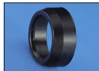
Pièce de réduction Réf. 75-100 RM ATEX Code : 4-10075-6