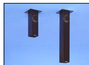
Colonne de plafond lg = 250 mm Réf. 75-250 SKN

Code : 2-250-050-20 (Refoulement vertical)