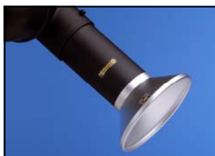
Cône d'aspiration aluminium Diamètre : 200 mm Réf. 100-200 HR ATEX Code informatique : 1-10024-6