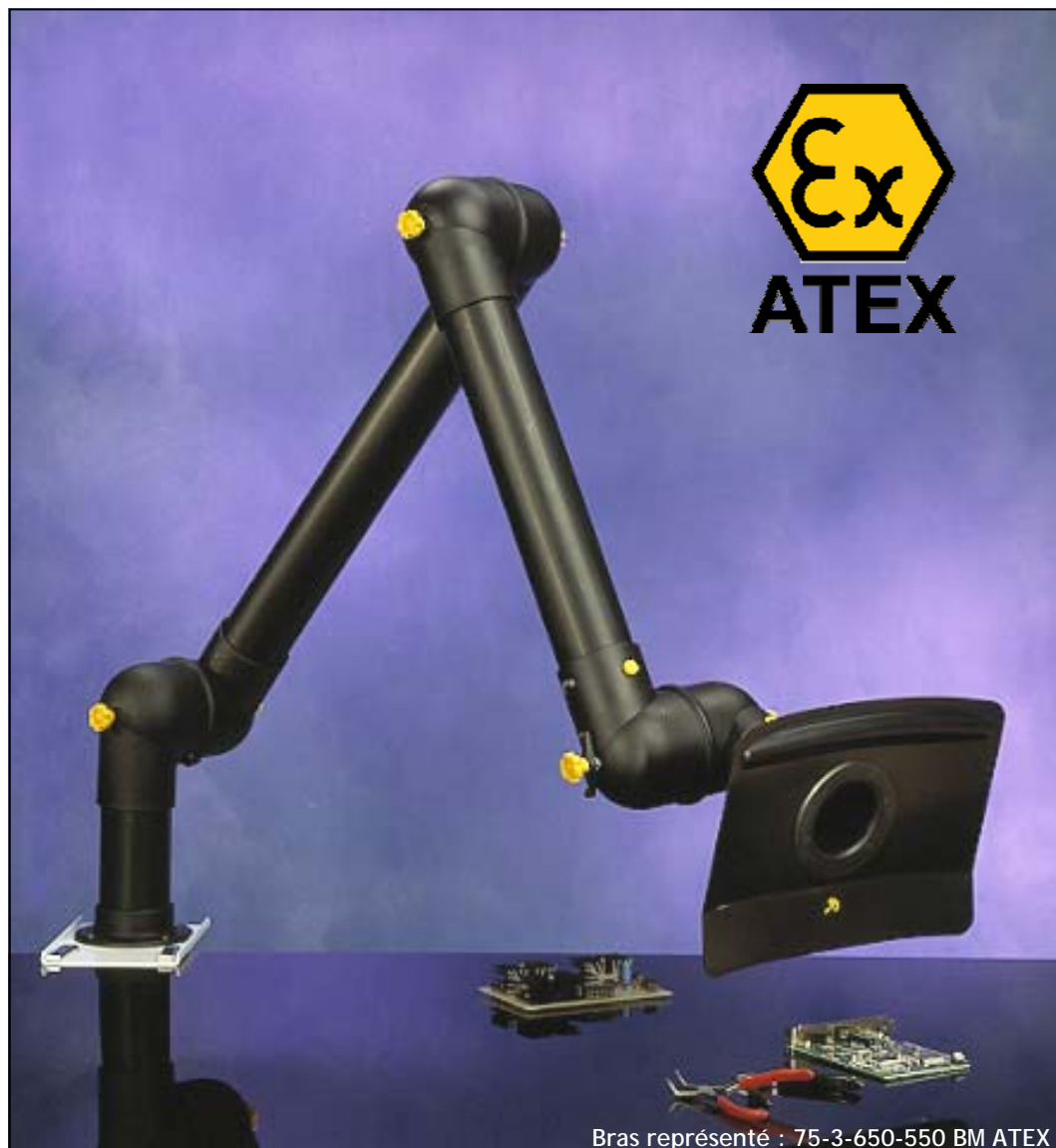
Bras représenté : 75-3-650-550 BM ATEX