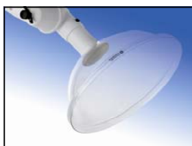
Hotte circulaire polycarbonate Diamètre : 350 mm Réf. 63-350 PC Code : 1-6335-5