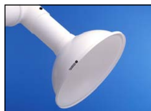
Hotte circulaire polypropylène Diamètre : 350 mm Réf. 100-350 PP Code : 1-10035-7-5