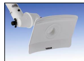
Ecran d'aspiration polypropylène L x l (mm) : 330 x 240 Réf. 63-330-240 PP Code : 1-633324-5