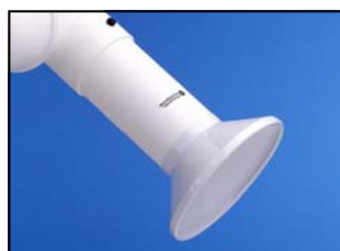
Cône d'aspiration polypropylène Diamètre : 200 mm Réf. 100-200 HR PP Code : 1-10024-7-5