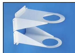
Console de fixation murale Réf. 100-350 VB Code : 2-10035