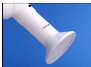
Cône d'aspiration polypropylène Diamètre : 200 mm Réf. 100-200 HR PP Code : 1-10024-7-5