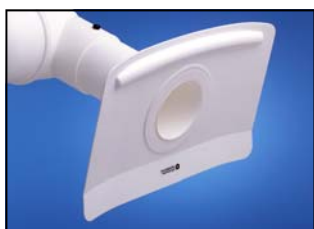
Ecran d'aspiration L x l (mm) : 420 x 280 Réf. 100-420-280 PP Code : 1-1004228-7-5