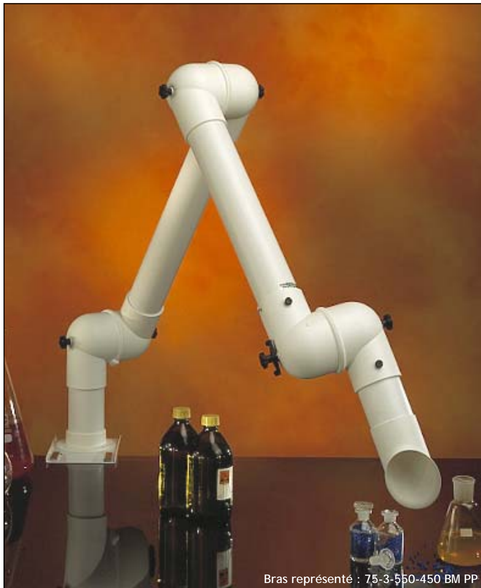
Bras représenté : 75-3-550-450 BM PP

75-3535-1-7-5 75-5545-1-7-5 75-6555-1-7-5 75-9065-1-7-5