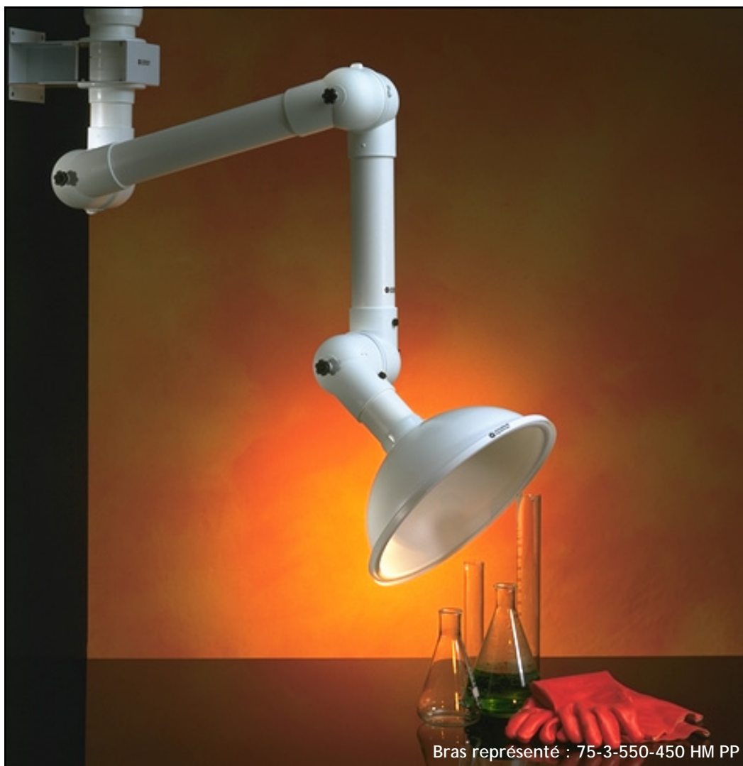
Bras représenté : 75-3-550-450 HM PP