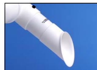
Bec d'aspiration Polypropylène Longueur : 250 mm Réf. 75-250 A PP Code : 1-7525-7-5