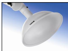
Hotte circulaire polypropylène Diamètre : 350 mm Réf. 63-350 PP Code : 1-6335-7-5