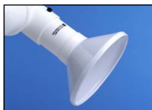
Cône d'aspiration polypropylène Diamètre : 200 mm Réf. 75-200 HR PP Code : 1-7524-7-5