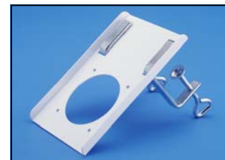
Console de table Réf. 75-100 BB Code : 2-7510