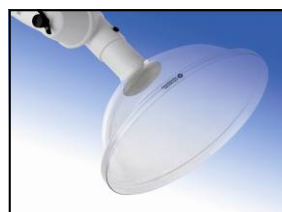
Hotte circulaire polycarbonate Diamètre : 350 mm Réf. 63-350 PC Code : 1-6335-5