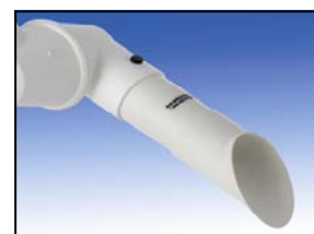
Bec d'aspiration Polypropylène Longueur : 250 mm Réf. 63-250 A PP Code : 1-6325-7-5