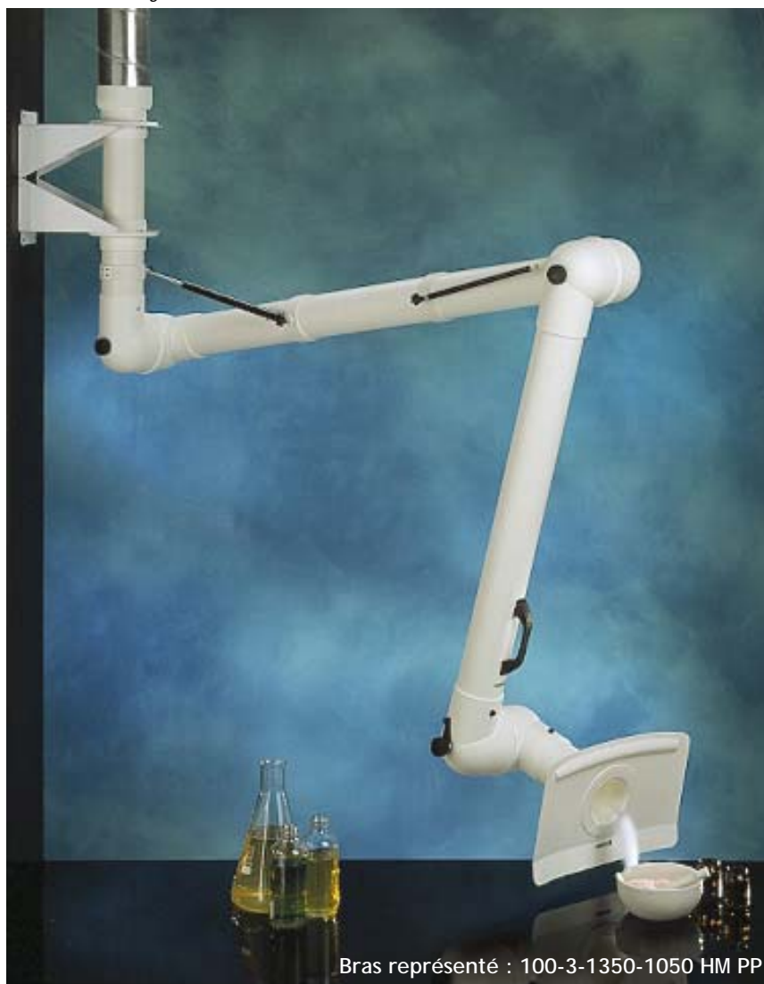
Bras représenté : 100-3-1350-1050 HM PP