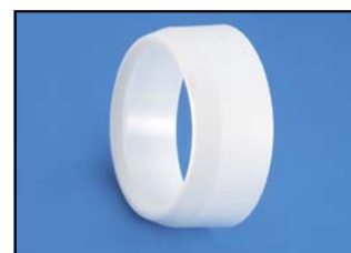
Pièce de réduction Réf. 125-100 RM Code : 4-100125