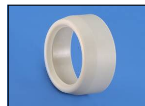
Pièce de réduction Réf. 63-100 RM Code : 4-10063 Réf. 63-80 RM Code : 4-8063