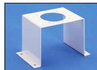
Etrier de fixation Réf. 30-75-5-5 Code : 30-75-5-5