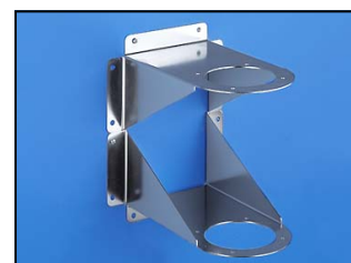
Console murale Réf. 100-350 VB INOX Code informatique : 2-10035-22