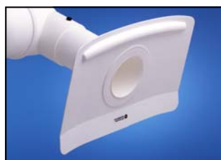
Ecran d'aspiration L x l (mm) : 420 x 280 Réf. 100-420-280 PP Code : 1-1004228-7-5