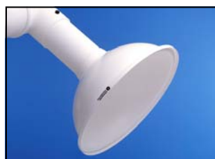
Hotte circulaire polypropylène Diamètre : 350 mm Réf. 100-350 PP Code : 1-10035-7-5