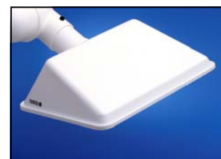
Hotte rectangulaire polypropylène L x l (mm) : 420 x 320 Réf. 75-420-320 PP Code : 1-754232-7-5