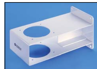
Console de fixation murale Réf. 75-250 VB Code : 2-10035