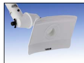
Ecran d'aspiration polypropylène L x l (mm) : 330 x 240 Réf. 63-330-240 PP Code : 1-633324-7-5