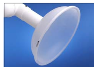
Hotte circulaire translucide polypropylène Diamètre : 500 mm Réf. 100-500 PP Code : 1-10050-7-5