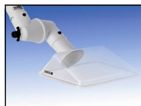
Hotte rectangulaire polycarbonate L x l (mm) : 245 x 220 Réf. 63-245-220 PC Code : 1-632422-5