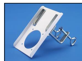
Console de table Réf. 63-100 BB Code : 2-6310