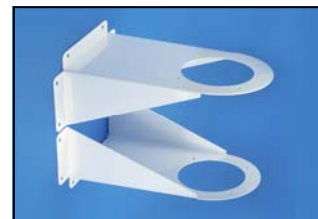
Console de fixation murale Réf. 100-350 VB Code : 2-10035