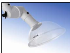
Hotte circulaire polycarbonate Diamètre : 280 mm Réf. 63-280 PC Code : 1-6328-5