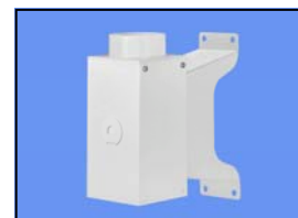
Console de fixation murale Réf. 63-250 VB Code : 2-195

63-3535-3-7-5 63-3590-3-7-5 63-5545-3-7-5 63-6555-3-7-5 63-9065-3-7-5