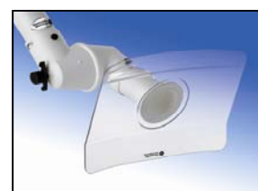
Ecran d'aspiration polycarbonate L x l (mm) : 330 x 240 Réf. 63-330-240 PC Code : 1-633324-5