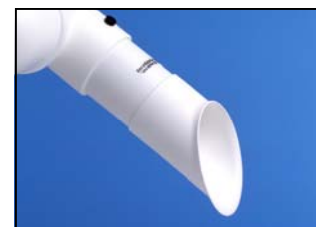
Bec d'aspiration Polypropylène Longueur : 250 mm Réf. 75-250 A PP Code : 1-7525-7-5