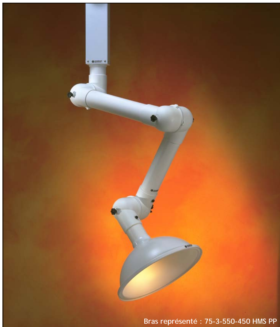
Bras représenté : 75-3-550-450 HMS PP