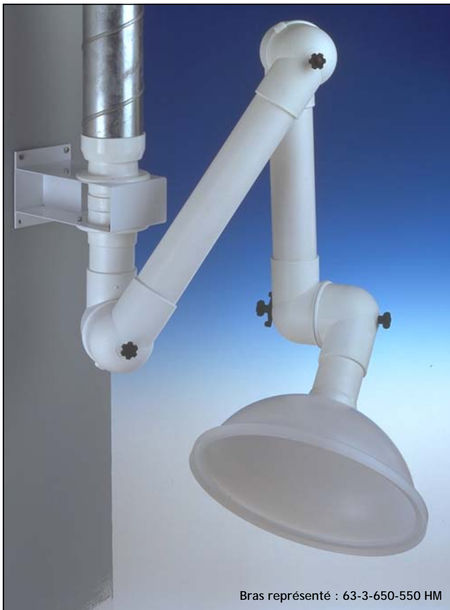
Bras représenté : 63-3-650-550 HM