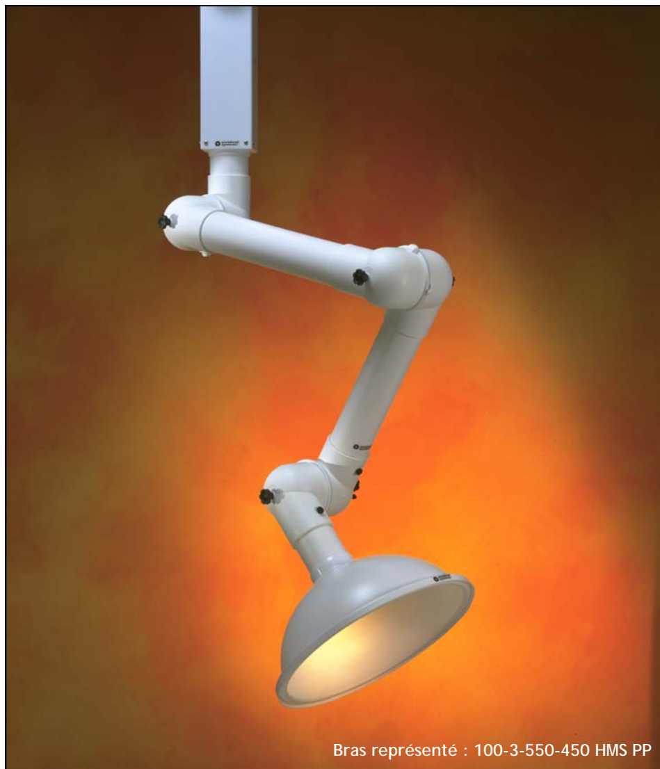
Bras représenté : 100-3-550-450 HMS PP