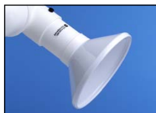
Cône d'aspiration polypropylène Diamètre : 200 mm Réf. 75-200 HR PP Code : 1-7524-7-5