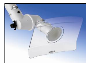
Ecran d'aspiration polycarbonate L x l (mm) : 330 x 240 Réf. 63-330-240 PC Code : 1-633324-5