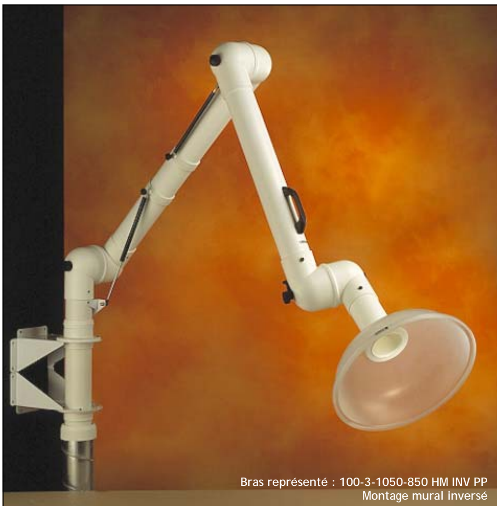
Bras représenté : 100-3-1050-850 HM INV PP Montage mural inversé