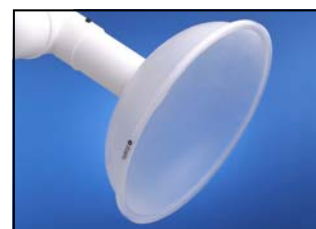
Hotte circulaire translucide polypropylène Diamètre : 500 mm Réf. 100-500 PP Code : 1-10050-7-5