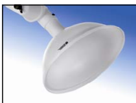
Hotte circulaire polypropylène Diamètre : 350 mm Réf. 63-350 PP Code : 1-6335-7-5