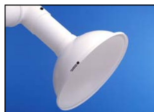
Hotte circulaire polypropylène Diamètre : 350 mm Réf. 75-350 PP Code : 1-7535-7-5