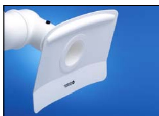
Ecran d'aspiration L x l (mm) : 330 x 240 Réf. 75-330-240 PP Code : 1-753324-7-5