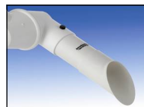
Bec d'aspiration Polypropylène Longueur : 250 mm Réf. 63-250 A PP Code : 1-6325-7-5