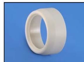
Pièce de réduction Réf. 63-100 RM Code : 4-10063 Réf. 63-80 RM Code : 4-8063