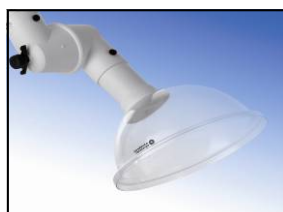
Hotte circulaire polycarbonate Diamètre : 280 mm Réf. 63-280 PC Code : 1-6328-5