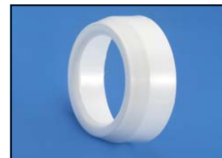
Pièce de réduction Réf. 75-100 RM Code : 4-10075